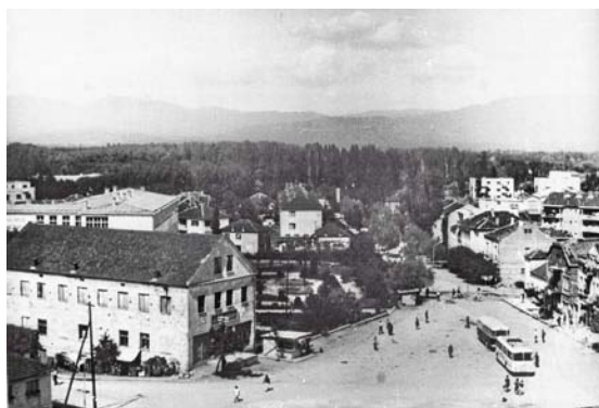
Центарот на Струмица во шесеттите години од 20 век.

каква воодушевеност од страна на децата и учениците биле проследувани сите згоди и незгоди на јунаците од цртаните филмови на Волт Дизни.