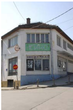
Зградата на некогашното култно кино „Балкан“, детал

вградиле или дале свој прилог во развојот на филмската култура во градот и регионот.