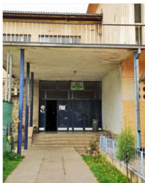
РУ „Јосиф Свештарот”, детал

Имено, Работничкиот универзитет во овој период организирал јавни трибини и предавања на кои биле застапени најразлични теми од тогашниот општествено-политички живот, но и теми од областа на културата и образованието. Во таа смисла, се организирале предавања како за филмот така и за уметноста, воопшто. Во Програмата за работа, реализирана во 1961, односно во 1962 година, пред струмичката културна и поширока јавност, на тема „За филмската уметност”, беседел нашиот познат писател Славко Јаневски (1920-2000) 20 , а пак Георги Старделов на тема со наслов „За уметноста” итн 21 . Потаму, под формата: „Филмска трибина”, организирана од страна на РУ, во 1959 година, се одржале 221 кинопретстави, на кои биле проектирани 208 филмови, со вкупно 20.750 посетители 22 . Со слични ефекти била и наредната 1960 година. Исто така, се користеле и други најразлични форми и содржини за промоција на филмот и филмската уметност. Така, на пример, во програмските активности за 1965 година, под формата „Филмски вечери”, биле застапени повеќе содржини посветени на филмската уметност 23 . Според еден Извештај пак од 1968 година,