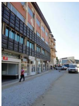
Мотив од Струмица - на аголот од ул. „Благој Јанков-Мучето” и бул. „М. Тито”