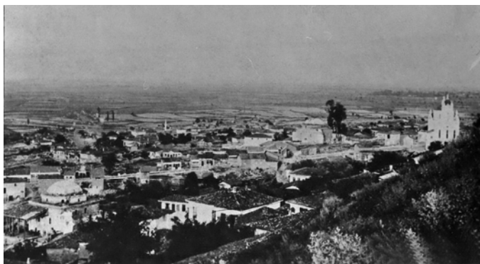
Панорама на Струмица, 1922 год.